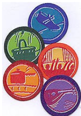
Badges de spécialités